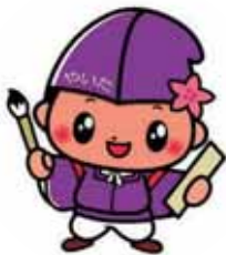
矢板市ともなひまつりマスコット 「ともなひくん」