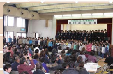
▲コミュニティ文化祭の様子

協議会の目的を「地域住民の自治精神を基として関係機関、団体と連携を密にし、住民の自主参加を促し、地域連帯意識を深め、健康で文化的な生活が営めるような地域づくりをすること」と定め、コミュニティ文化祭や