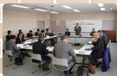
▲Jプロツアー実行委員会の様子

コミュニティ活動の中で、多くのことを自主的・主体的に行ってきましたが、今回のJプロツアーのイベントでは、市や関係機関、各種団体、専門家などの協力を得