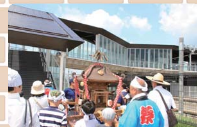
▲神輿が駅を渡る様子

地元有志によるにぎわいづくりも盛んに行われました。昨年 4 月の駅西口オープンイベントに始まり、夏には 20 年ぶりとなる子ども神輿を復活させ、神輿が