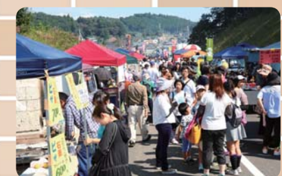
▲かたおか軽トラ市の様子

片岡ににぎわいをつくりたいとの思いから、片岡地区での軽トラ市開催を提案し、市商工会の協力もあって、「かたおか軽トラ市」が昨年 10 月に行われました。