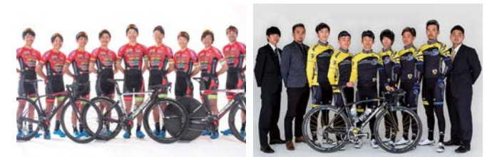
宇都宮ブリッツェン

ギャラリーが一体となってレースを盛り上げています。初心者から未来のプロを目指すライダーのため「Jエリートツアー」があり、段階を踏んだレベルアップが可能です。これからロードレースをはじめのライダーには、ヒルクライムレースを主体とするツアー「Japan Friendship Cycleroadrace=JFC」も開催されています。