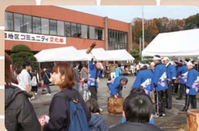
▲コミュニティ文化祭の様子

これまでのコミュニティ活動により培った、何事にもみんなで協力し合いながら取り組む気質が、片岡というまちには根付いています。