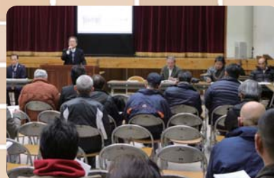
▲150人が集まった準備委員会の様子

先人が築いたコミュニティ精神を受け継いだ我々が、その精神を守り、そして発展させ、次の世代へと引き継いでいくことが、将来にわたり多くの人たちでにぎわう、片岡の明るい未来につながるものと信じています。