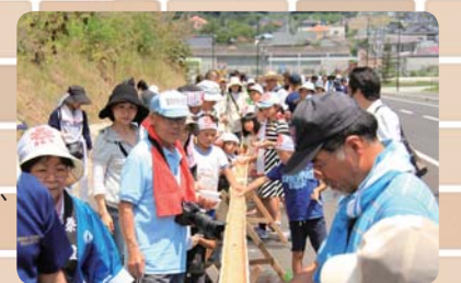
▲流しそうめんを楽しむ様子

橋上化された駅を渡りました。渡った先の西口では、安沢地区の方の協力で切り出してきた竹を使い、87m の流しそうめんを行いました。駅の東西に住む人たちが、流しそうめんを楽しみながら交流する姿を見て、東西の一体感がさらに高まったのを感じました。