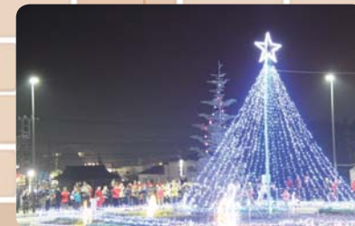
▲片岡イルミネーションの様子

片岡地区は、JR 宇都宮線が縦貫しているため、これまで、線路の西側に住む人たちが駅を利用する際に、線路を渡って改札のある駅の東側に行かなければなりませんでした。駅の橋上化・駅西口の整備により駅西側からのアクセスが格段に向上しました。これを機に、駅東西地域の一体感が感じられるようなにぎわいをつくらせ、協議会や有志によるさまざまなイベントが企画されました。