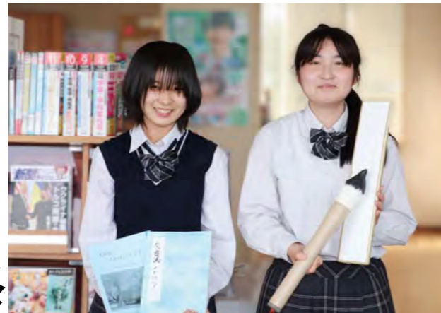
矢板中央高校 文芸部

全国大会で受けたたくさんの刺激を、しっかりと後輩へつなげ、伝統ある新聞部の未来に役立てたいです。