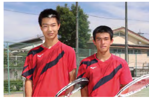
矢板中央高校 ソフトテニス部

小学3年生の時、母の職場であるボウリング場から、マイボールをもらったことをきっかけに、ボウリングを始めました。楽しくて夢中で練習していたら、指をけがしてしまいボウリングができなくなりました。その時出会った投法が、両手投げです。両手で投げることで、人よりも回転が強くカーブするボールを投げられるようになり、自分の大きな武器となりました。そして今年4月、栃木県としては初めての全日本ユース代表選手に選ばれました。結果が残せず悔しかった昨年のとちぎ国体をバネに練習に励んできたので、今回の全日本高校選手権はもちろん、どんな大会でも結果を残し、技術面・精神面共に強い選手になり、国際大会出場を目指します。