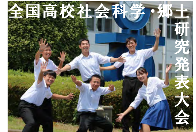
矢板東高校 リベラルアーツ同好会

今は、全国大会に向けて実際に着用するドレスの作製に取り組んでいます。全国レベルの作品に触れ、たくさんのことを吸収して、将来につなげていきたいです。