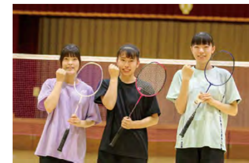
矢板東高校定時制 バドミントン部