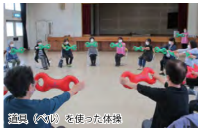
道具(ベル)を使った体操