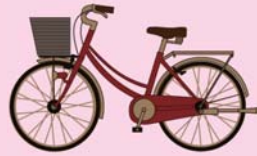
自転車のシェア No.1 は シティサイクル (ママチャリ)

みなさんがよく乗る「シティサイクル」、いわゆる「ママチャリ」とは、一体何が違うのでしょうか？