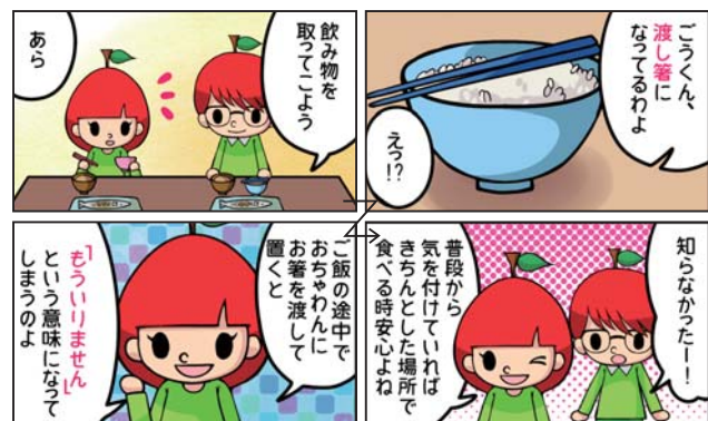
参考資料「テーブルマナーの絵本」596 タカ