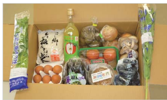
(写真はイメージです)