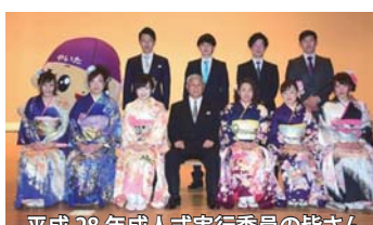
平成 28 年成人式実行委員の皆さん

✉ syougaigakusyuka@city.yaita.tochigi.jp