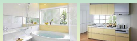
コンテスト受賞作品は

全国規模のリフォームコンテスト「T・D・Yリモデルマイルコンテスト」において、全国最優秀賞(トイレ部門)、北関東地区奨励賞(キッチン部門)を受賞。水回りのリフォームはぜひスミスケにご相談ください。