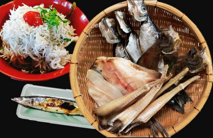
三陸・常磐もの海産物イメージ

今年もやります！「新米フェア」 矢板市産の新米を なんと全品10%OFFで販売します！ また、三陸・常磐ものを取り扱う 「お魚フェア」も同時開催！ 海産物の販売やキッチンカー、 シラス弁当当販売等、盛りだくさん！ ご家族、ご友人などお誘いあわせ のうえお越しください。