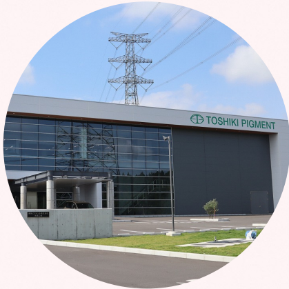
東色ピグメント 株式会社 矢板工場 矢板市こぶし台6-3