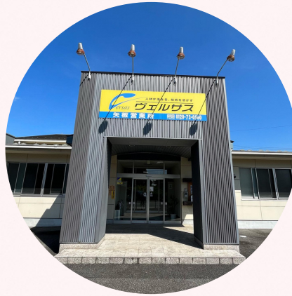
株式会社 ティー・シー・シー 矢板営業所 矢板市木幡184-2