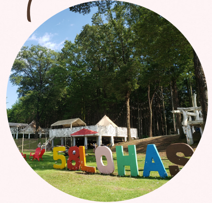
株式会社 グリーンヘリテージ (58口ハスクラブ) 矢板市安沢2180