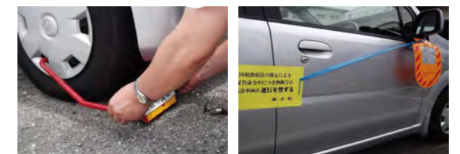
タイヤロックをかけている様子