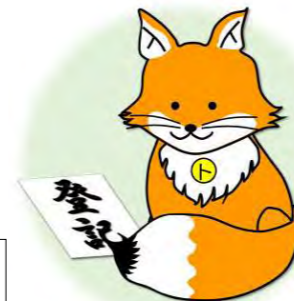
不動産登記推進イメージキャラクター「トウキツネ」