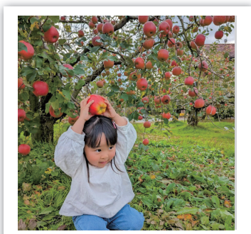
_mini_omi_さん 今年もおいしいリンゴがたくさん実りました。リンゴ狩り楽しかったかな?!

「#yaitagram」では、矢板での暮らし・風景など、あなたの好きな矢板市を募集しています。皆さんも公開アカウントでyaita_city_officialをフォローし、Instagramの投稿に「#yaitagram」を付けて矢板市の魅力を発信してみませんか。