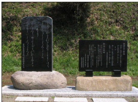
碑を作ったことです。