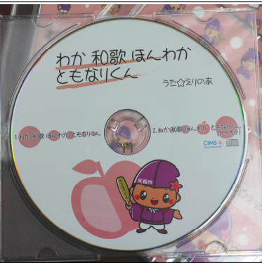
ともなりくんの歌のCDができました(発売中!!)

●あんどんまつり あんどんまつりも参加型イベントを目指しています。今年は、川崎小学校の子どもたちに絵を描いてもらって、百二十本のあんどんを新調しました。 また、新しい試みとして、 灯籠流し を行います。皆さんも願いを込めて灯籠流しに参加しませんか? 毎年ネックとなっているのが運営スタッフです。川崎城跡公園再生市民会議の会員を中心に、準備から後片付けに至るスタッフ集めに苦労しています。昨年からは、やはり倶楽部の若いメンバーに参加していただき心強く感じています。もっと若い方