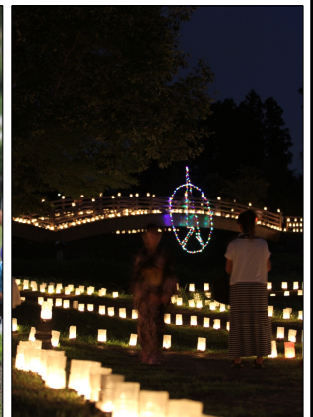
昨年のおんどんまつりの様子