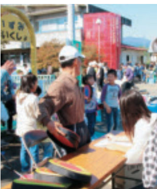
泉地域ふれあいまつり

自治公民館の活動支援と新生活運動の補助を行い、地域づくりを支援します。(矢板・泉・片岡の各公民館)