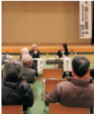
ふるさと創年大学

ふるさと創年大学などを開催し、学習機会の充実を図るとともに、人材バンクの活用や生涯学習情報誌「まなび」による情報提供を行います。