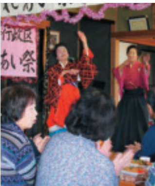
合会行政区ふれあい祭り (地域コミュニティ推進事業)

地域のつながりを取り戻すため、地域コミュニティ活性化プラン作成や地域コミュニティ活動に対し、各種支援を行います。