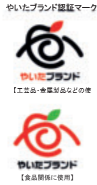
やいたブランド 【工芸品・金属製品などの使 【食品関係に使用】

市内にある優れた農林水産物や商品を「やいたブランド」として認証し、また新たなブランド開発などに関する支援を行い、地域経済の活性化と市のイメージアップを図ります。