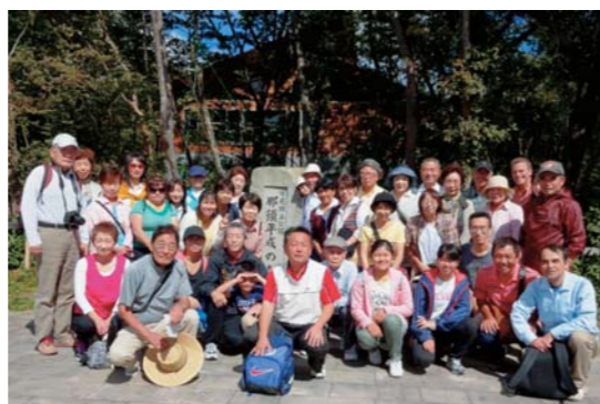
9月14日 那須平成の森バスハイキング