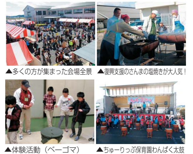
▲多くの方が集まった会場全景 ▲復興支援のさんまの塩焼きが大人気！ ▲体験活動(ベーゴマ) ▲ちゅーりっぷ保育園わんぱく太鼓

今年は、生涯学習館・矢板公民館・文化会館を会場に「矢板市文化祭」「福祉まつり」と合同開催。天気の良い秋空のもと、大勢の方が来場し、1日中、太鼓の音や子ども達の声が響き渡りました。