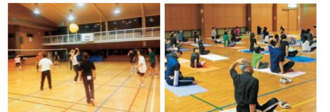
▲さいかつぼーる ▲ファミリーヨガ 問い合わせ/市スポーツ推進委員会事務局(生涯学習課) ☎(43)6218

次年度も健康ひろばで、さまざまなスポーツを紹介していきます。予定については、広報やいたと市ホームページでお知らせします。皆様のご参加をお待ちしています。