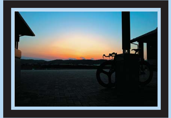
トレーニング後の道の駅より 平成26年10月11日(土)

「自転車で市内を良く走るのですが、毎回休憩の為に道の駅を利用します。そんなとある日です」