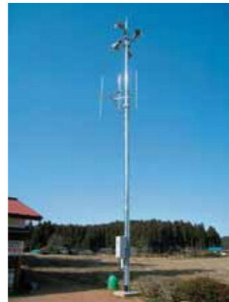
問い合わせ／総務課 防災管財班 ☎(43)1113

市では、防災行政無線の整備を平成24～25年度にかけて進めています。全体計画においてはスピーカーを101カ所設置する予定のところ、平成24年度末までに学校や公民館等を中心に60カ所の設置工事が完了しました。 今年度から随時試験運用を開始しますのでご理解をよろしくお願いいたします。 また、今年度も市内各所において残りの設置工事を進めていきますので、ご協力をお願いします。