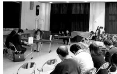
模擬相談会の様子

この相談会は、塩谷郡2市2町の地域包括支援センターが連携して行っています。困ったときは、あなたのまちの地域包括支援センターにご相談ください。