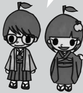
矢板市立図書館イメージキャラクター「ごうくん」と「りんちゃん」