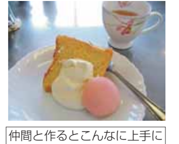
仲間と作るとこんなに上手に