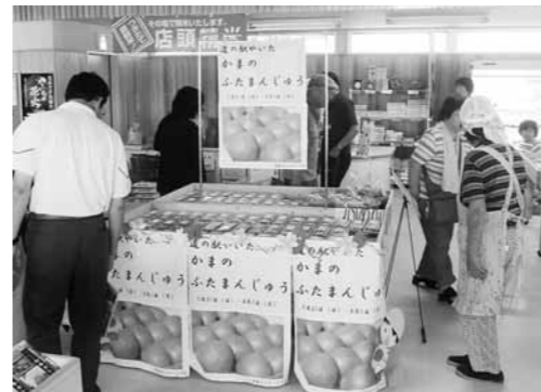
お盆の「かまのふたまんじゅう」

道の駅やいたでは、お客さまに、いつ来ても楽しんでいただけるように、毎月イベントを行ってまいります。そのイベントでは、都会などでは失われてしまったような歳時を味わえるようにしています。例えば、春の