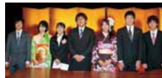
平成24年成人式実行委員の皆さん

※8月から成人式当日までに会議を3回程度行います。 ※すべての会議に参加できなくても応募可能です。