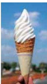
りんごのソフトクリーム

なつかしい味をめざって わたしたちつつじ亭のコンセプトは、「地産地消」はもちろんのことですが、どこか懐かしいおふくろの味を味わってほしいという思いがあります。「地元のお米」をできるだけ多く使用し、地元産の農家のお母さんたちが、愛情を込めておいしい料理に仕上げている。これをオープン当初から一貫しています。オープン当初は、不慣れなため、料理ができるまでお待たせしてしまつたこともありました。スタッフ一同毎日のように努力を続けた結果、待ち時間はだいぶ短縮されてきたと思えます。