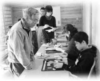
多くの子どもたちが参加するエコ活動体験イベント(木工体験教室)

道の駅やいたから エコを発信 道の駅やいたには、全国20ヶ所のうちのひとつに選ばれ、建設されたエコモデルハウスが併設されています。ここは自由に見学することができます。エコボランティアが、エコ建築の紹介をしています。休日などには、さまざまなエコ活動体験イベントを通じて、来ていただいた方にエコライフのスタイルを提案しています。道の駅でもトイレの水に雨水を利用したり、ソーラーパネルによる電気利用などエコの工夫が織り交ぜられています。また、道の駅のコンセプト「地産地消」も運送に要する