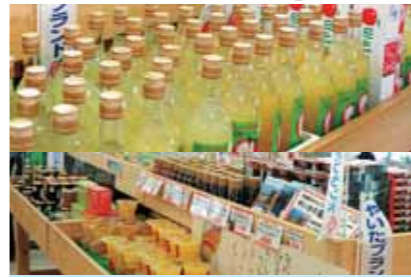
現在26品目が認定され、「旬鮮やいた」には多くの商品が並んでいます。お土産などに、いかがですか？

一年が経過して 道の駅がオープンして一年が経過しました。現在、会員231人の皆さんと一緒に「旬鮮やいた」を運営しています。おかげさまで、運営は順調に推移しています。オープン当初は、慣れない接客でレジでお待たせしてしまったこともありましたが、今はノウハウもできてきて、やっと落ち着いてきました。オープン当初から、「地産地消」を合言葉に皆で頑張っています。