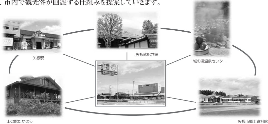
道の駅やいた 営業時間

道の駅が持つ情報発信機能。そして市内の観光地・名所が持つ集客力。それらを「道の駅やいた」を核として密に連携し、市内で観光客が回遊する仕組みを提案していきます。