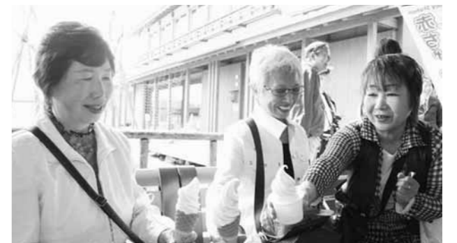
「やいたの桜ツアー」に参加し、道の駅に立ち寄った日光市の方々

巡っていただきたいと考えています。これからも道の駅が矢板の魅力を引き出し、詰め込んだ施設として機能するよう頑張っていきます。