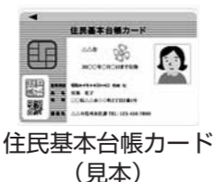
住民基本台帳カード（見本）

ただし、電子証明書は市外転出により失効しますので、新住所地の市町村窓口であらためて申請が必要になります。