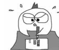
栃木県統計課 マスコット キャラクター 統計トリ子

HP http://www.pref.tochigi.lg.jp/c04/pref/toukei/toukei/top.html