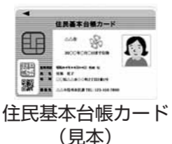
住民基本台帳カード（見本）

ただし、電子証明書は市外転出により失効しますので、新住所地の市町村窓口であらためて申請が必要になります。