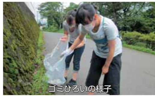
ゴミひろいの様子