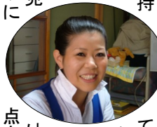
美容師免許を持つともさん

●子育てをしている中でほかに気づいたことをお聞きすると、「室内で自由に遊ばせる場所がないので、体育館などで親子連れが自由に遊べるとうれしいですね。また、歩道が狭いため子どもを連れて歩くのが大変です。ベビーカーを押して自転車とすれ違えないので、せめてあと三十センチ広げれば安心なのと思ひます」と、ママでなければわからない視点も。