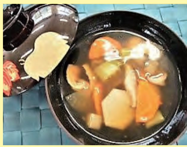
レシピ提供元：矢板高校栄養食物科チーム☆道の駅