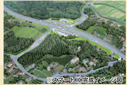
※スマートIC完成イメージ図

また、(仮称)矢板北スマートICの整備にも引き続き取り組み、2021年3月の開通を目指します。