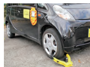
自動車差押えの様子

市では滞納者宅等の捜索を行い、差押えを行っています。差押えたものは公売にかけ、売却代金が税にあてられます。