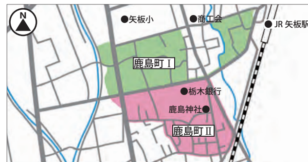
【鹿島町Ⅰ地区・Ⅱ地区】