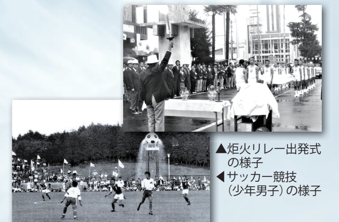
▲炬火リレー出発式の様子 ▲サッカー競技(少年男子)の様子