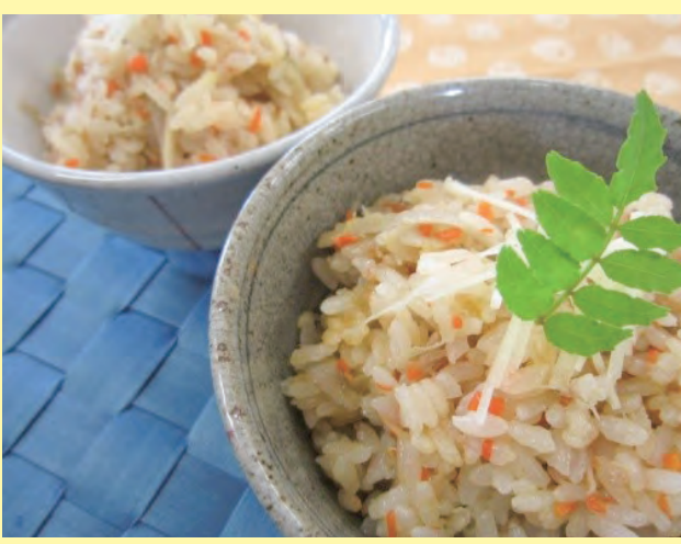
レシピ提供元：矢板高校栄養食物科チーム☆道の駅