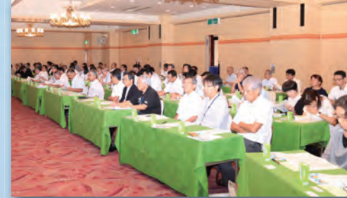
いちご一会とちぎ国体矢板市実行委員会 設立総会の様子

今年度は、11月4日（振休・月）にとちぎフットボールセンターで開催したいちご一会とちぎ国体開催決定記念イベント「SOMPO ボールゲームフェスタ in 矢板」を皮切りに、国体関連のイベントなどを通して、国体開催の周知を図るとともに、市民の皆さまの機運醸成を図っていきたくと考えています。