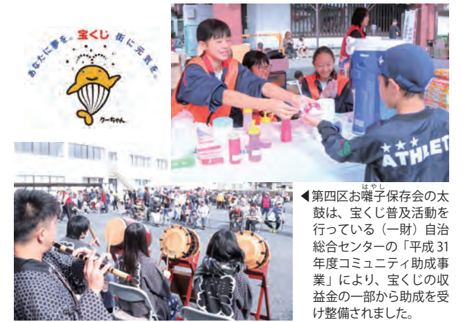
▲第四区お囃子保存会の太鼓は、宝くじ普及活動を行っている(一財)自治総合センターの「平成31年度コミュニティ助成事業」により、宝くじの収益金の一部から助成を受け整備されました。

当日は、中学生をはじめとするボランティアのみなさんが各イベントで活躍し、会場を盛り上げました。また、子どもからお年寄りまで多くの方が訪れ、模擬店やステージアトラクションを楽しむなど、にぎやかな1日となりました。