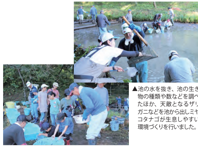
▲池の水を抜き、池の生き物の種類や数などを調べたほか、天敵となるザリガニなどを池から出しミヤコタナゴが生息しやすい環境づくりを行いました。

この日は、自然観察教室も開かれ、親子11人が参加し、池に住む生き物の多様性を学びました。参加した子どもたちは「池には、ミヤコタナゴのほかに、いろいろな生き物がたくさんいて、それぞれが協力し合って生きることがわかった。豊かな自然を守るために、生き物にやさしい生活をしたい」と話してくれました。