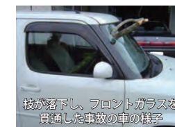
枝が落下し、フロントガラスを貫通した事故の車の様子

あなたの土地の樹木が道路に倒れる、または張り出したり枝が落ちたりして、歩行者などの通行の妨げになっていませんか？