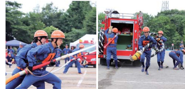
消防ポンプ自動車操法の部

消防ポンプ自動車の部で優勝した第 5 分団第 2 部は、7 月 28 日 (土) に行われた第 43 回栃木県消防操法大会に塩谷地区を代表して出場しました。