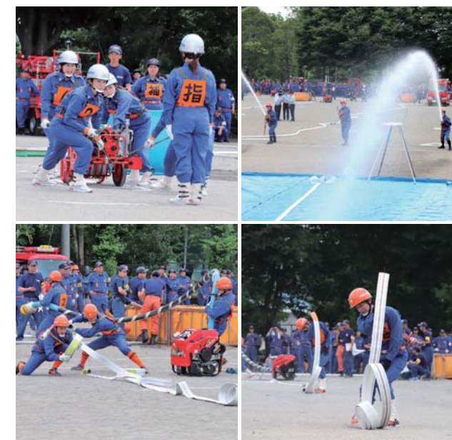
小型動力ポンプ操法の部