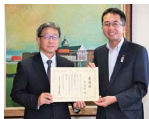
感謝状を受け取る市長