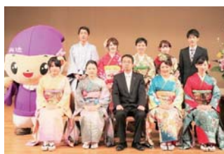
平成30年成人式実行委員会の皆さん

申込方法 ／ 7月27日（金）までに電話、ファクス、またはメールでお申し込みください。 ※ファクス、メールでお申し込みの際は、件名に「成人式実行委員」と明記し、名前・住所・電話番号をお知らせください。 申込・問い合わせ ／ 平成31年成人式実行委員会事務局（生涯学習課） ☎（43）6218 FAX（43）4436 ✉ syougaiakusyuka@city.yaita.tochigi.jp