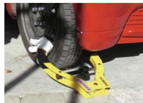
自動車などを差押えるときはタイヤをロックします。

納期限までに税金が納められていないときは、督促状が配布されます。配布の日から起算して10日を経過した日までに完納されないと、預貯金・保険・給与・土地・建物・自動車・オートバイの差押えなどの滞納処分を受けることになります。