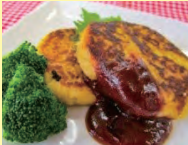
レシピ提供元：矢板高校栄養食物科チーム☆道の駅