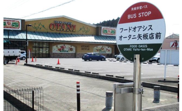
「フードオアシスオータニ矢板店前」に名称を変更したバス停

令和3年10月1日から、矢板市の公共交通がリニューアルしました。矢板駅周辺を循環する「中央部循環路線」のバス停の名称に愛称を付ける権利(ネーミングライツ)を取得する企業等を募集します。