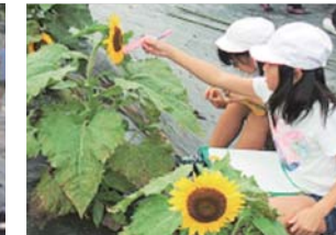
ひまわりの成長を観察する児童の様子