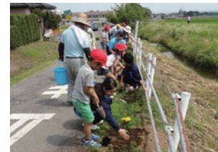
地域の方と小中学校合同で花を植える活動をする様子

泉中学校は、「地域社会に根差した教育」を掲げ、地域と連携した行事を通して取り組んでいる「生き方教育」により、生徒一人ひとりの自己実現に向けた基盤づくりが着実に進んでいる点が評価されました。また、大学との連携や小学校との一貫教育の推進など学力向上への取り組みも評価されました。