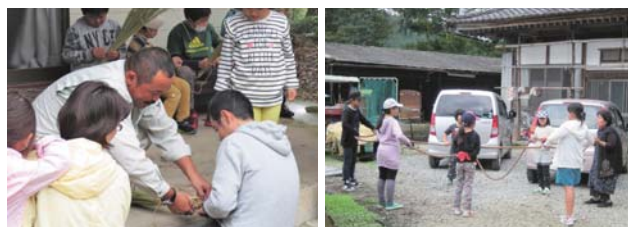
「ぼうじぼづくり」の様子（土屋地区） 「じゅずまわし」の様子（上伊佐野地区）

皆さんのお住まいの地域でもさまざまな行事が開催されていますので、積極的にご参加ください。