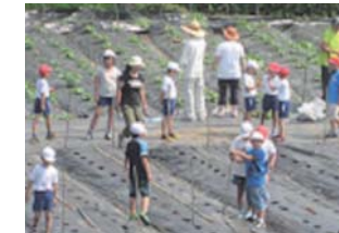
地域の方と500本のひまわりを植えている様子

乙畑小学校は、ノート指導の徹底により「書く活動」の充実、習熟度別授業の実施やコース別学習プリントの活用などの取り組みにより学習成果が向上したこと、地域・PTAと連携したひまわり栽培活動、それと連動した理科研究（ひまわりの観察）で県の理科研究最優秀賞を受けるなど、「学校教育・家庭教育・地域の教育」の総合力が優れていることが評価されました。