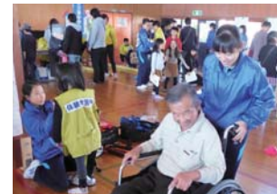
福祉まつりでボランティアとして活動する様子