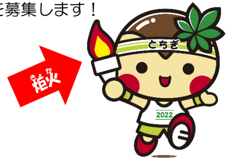
栃木県マスコットキャラクター