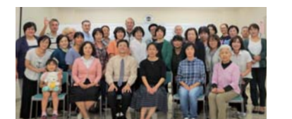
▲手話奉仕員養成研修を修了された皆さん

聴覚に障がいのある方のコミュニケーション方法の一つとして重要な「手話」です。矢板市では、塩谷町と合同で、「手話奉仕員養成研修」を実施しました。初めて手話を学ぶ方を対象に、昨年10月から今年9月までに計40講座を実施し、矢板市では15の方が修了されました。今後の活躍が期待されます。