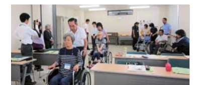
▲第2回講座では、車いすの押し方などを学びました

障がいの特性や障がいのある方への支援について学び、障がいのある方と共に活動する「障がい者福祉ボランティア育成講座」を実施しています。9～12月に実施される全8回の講座を通して、障がいについて学んだ後、障がい者福祉ボランティアとして活動していただきます。来年度も開催予定です。