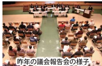
昨年の議会報告会の様子