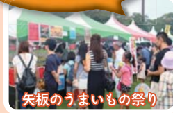
矢板のうまいもの祭り