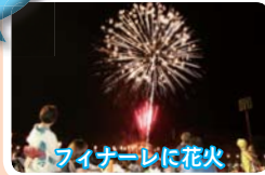
フィナーレに花火