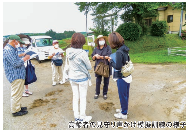
高齢者の見守り声かけ模擬訓練の様子