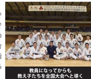
教員になってからも教え子たちを全国大会へと導く

自分の空手道の経験を生かし、大学時代には小・中学生の空手道セミナー等で指導をしていました。さらに高校の教員であった前職では、かつて所属していた高校の空手道部顧問に就き、全国大会や関東大会でも結果を残すことができました。全国各地の中学生を対象とした合同練習会を主催し、指導に当たったこともあります。