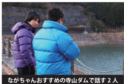
ながちゃんおすすめの寺山ダムで話す2人

でも、矢板のイベントに遊びに来てくれたり、他市町のイベントで矢板のPRをさせてくれたりってことはありました！そういう時は、やっぱり、他市町と協力していくことって大事なんだな、って感じましたよね。