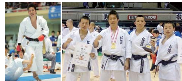
高校・大学ではインターハイや全国大会で表彰台を飾ってきた

高校・大学では、競技者としてインターハイや国体に出場し、「全日本学生空手道選手権大会団体組手」では、