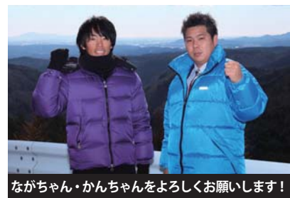
ながちゃん・かんちゃんをよろしくお祈りします！