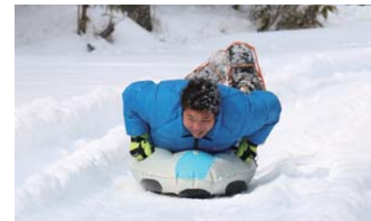
スノーシューに続き、エアボードも初体験！

漆：方向転換の時だけ気を付ければ、誰でも簡単に楽しむことができますよ！少し坂道があれば、エアボードなんかも楽しめますね！