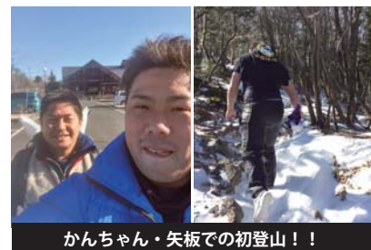
かんちゃん・矢板での初登山！！

神：ほんとだ！いい景色ですね！ 引越してすぐの1月7日に八海山神社に行ってきました！教員時代の友人と登ったのですが、軽装で行ってしまったので、なかなか大変でした（笑）