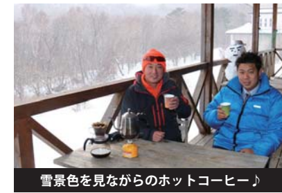
雪景色を見ながらのホットコーヒー♪

ほかには、せっかくあってもなかなか使われていない施設をうまく活用できたら…と考えています。例えば、旧長井小なんかは立地もいいですし、体育館などの施設もあるので、宿泊施設として合宿などで使ってもらえるようにできれば、+αとして八方ヶ原などで遊ぶ、なんてパッケージプランも提供できそうです！