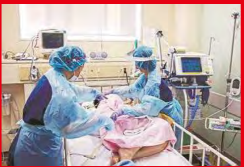
赤十字病院での新型コロナウイルス感染症対応