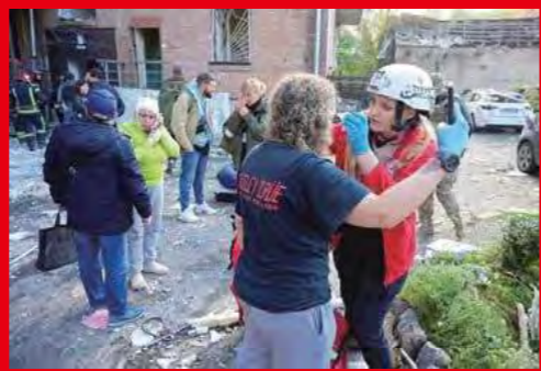
ウクライナ人道危機に対する救援活動