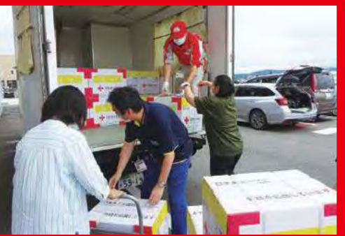
令和4年8月大雨災害の救護活動(山形県)

生活を壊す自然災害。日常を奪う感染症。やまない戦禍。 すべては同じ空の下で起きている現実です。 苦しんでいる人々を「救う」活動を続けるため、 どうか、赤十字活動資金への温かいご協力をお願いいたします。