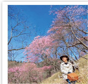
今年のミツモチ山のアカヤシオ群生地は、近年まれにみる花の多さでした。

「#yaitagram」では、矢板での暮らし・風景など、あなたの好きな矢板市を募集しています。皆さんも公開アカウントでyaita_city_officialをフォローし、Instagramの投稿に「#yaitagram」を付けて矢板市の魅力を発信してみませんか。