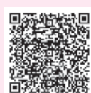
チャリプロフェイスブック

チャリプロでは、今後もセッティング会やポタリング等の開催、「じてんしゃの駅」普及に向けて、活動を行っていきます。また、フェイスブックで日々の活動の様子やイベント情報の発信などを行っていますので、ぜひご覧ください。