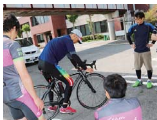
メンバーのフォーム確認後に

5月14日(土)市役所で、チャリプロ(自転車を活用したまちづくりプロジェクトチームの通称)の第1回セッティング会を開催しました。