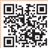
▲地図はこちらから