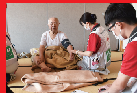
医療チームの活動(令和5年7月大雨災害)