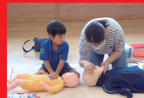
赤十字幼児安全法講習(さくら市)