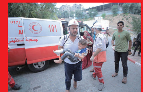
ガゼ 負傷者の搬送