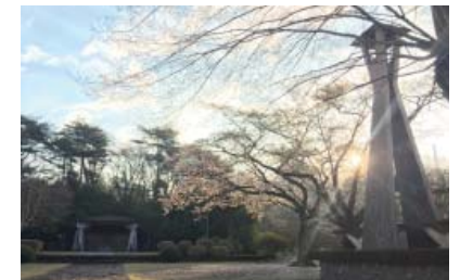
原爆死没者に黙とうを

8月6日8:15は広島市に、8月9日11:02は長崎市に原爆が投下された時刻です。当日は原爆死没者のご冥福と世界の恒久平和を祈って黙とうをささげましょう。