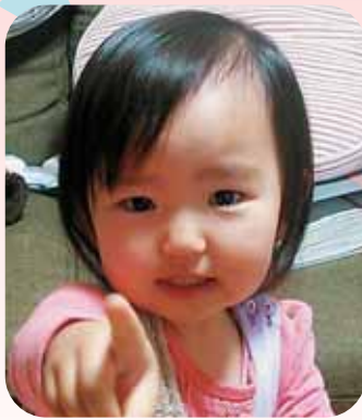
本町 大谷 わか 和愛 な ちゃん

問い合わせ/ 秘書広報課 ☎(43)3764 ✉ yaita@city.yaita.tochigi.jp