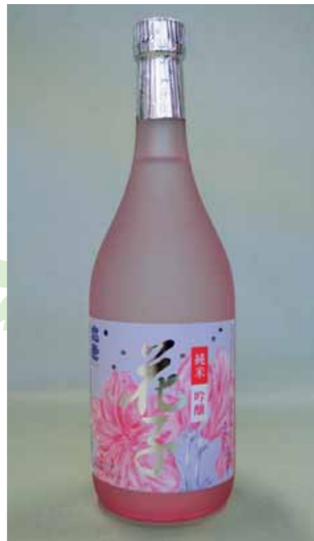
右の写真は、やいたブランドにも選ばれている純米吟醸「花子」。飲み口がさわやかで女性にも人気。