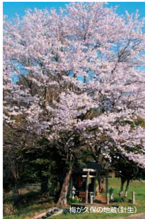
梅が久保の地蔵(針生)