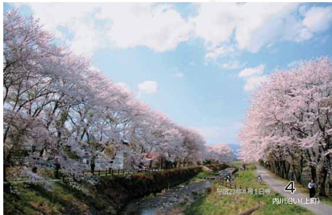
4 内川沿い(上町) 平成27年4月1日号