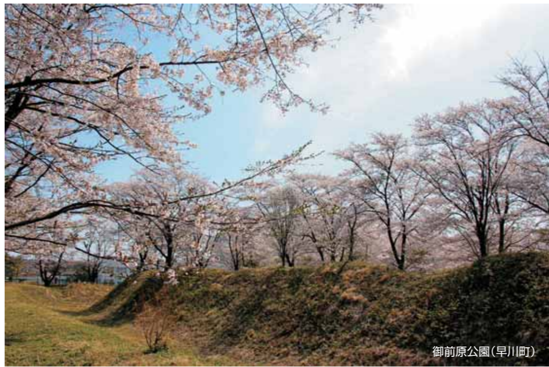
御前原公園(早川町)