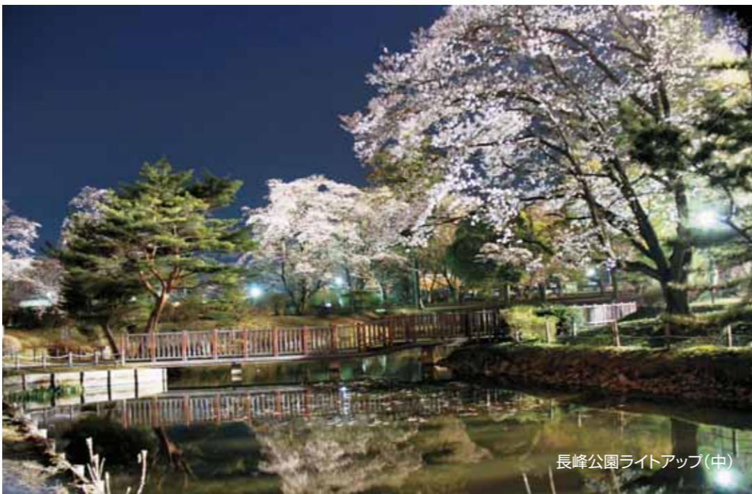
長峰公園ライトアップ(中)