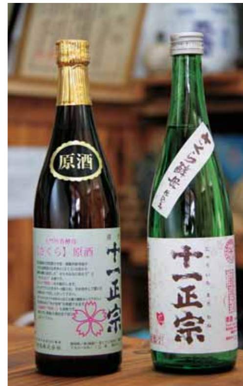
左の写真は、やいたブランドにも選ばれている「さくら・原酒」と「十一正宗・さくら」。桜の花から採取した酵母を使用。まるやかな口当たりと、キレの良さが特徴。