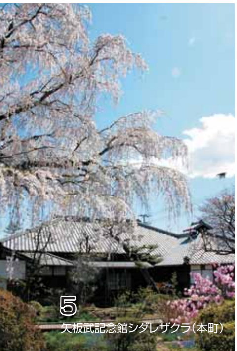
5 矢板武記念館シダレザクラ(本町)