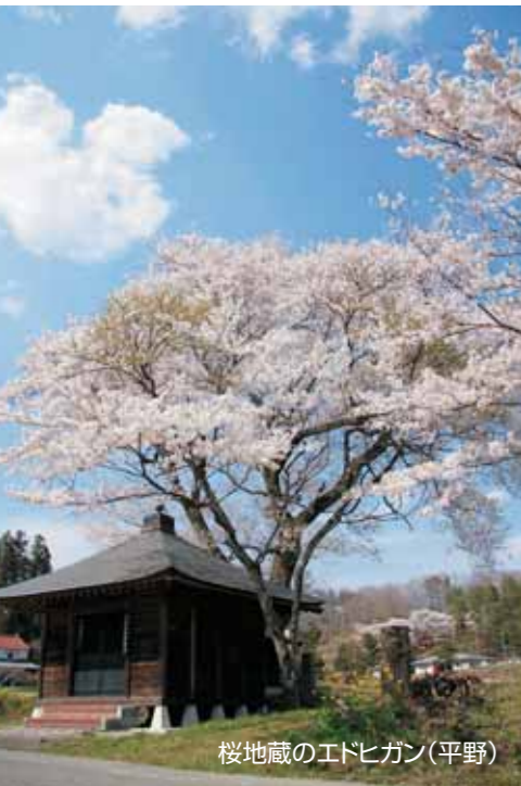
桜地蔵のエドヒガン(平野)

仲のよい兄弟分、花見に行きたいがお互いウツカ ラカ。 兄貴分が花見をしながら酒を売って儲けよう 言う。 酒屋で2両の酒と酒樽、何も食っていないとい う弟分に芋でも買おうと1貫借り、向島へ向う。 1杯を1貫で売って酒全部売れば4両、差引き 2両の儲けという寸法だ。 そして4両でまた酒を仕入れれば8両で売れ、 4両の儲け。8両で酒を仕入れて16両の売り上 げ。こんなんまい、商売はないという算段だ。 向島へ向う途中、弟分が腹が減ってしょうがな いという。兄貴分も樽の中の酒のいい匂いがたま らないという。 弟分はそれなら持っている1貫で買って2人で 半分づつ飲めばいいと言う。 兄貴分は弟分に1貫渡し、コップについて飲みは じめ1杯全部飲んでしまう。 弟分が怒ると、兄貴分は今渡した1貫で飲め ばいいという。 弟分は受け取った1貫を兄貴分に払い1杯飲 む。 こうなると止まらない。お互いに1貫づつやり とりし、1杯づつ飲み続け向島に着く頃には酒樽 は空に、2人はへべれけに酔っ払っしまふ。 酒樽を降ろし、店開きをする客が来る。 柄杓で樽の中をすくうが、むろん酒は入らない。 客が樽の中をのぞくと空だ。 全部売り切れたから売上げの勘定をしようと 金を出すと、1貫しかない。 兄貴分「2両の酒が売って1貫とはどうい うわけだ。おかしいじゃねえか」 弟分「どういうわけって、はじめにおめえが1貫 で買って1杯飲み、次に俺が1貫で買って飲み、お めえが買って、俺が買って、おめえが買って、やつてい るうちに売り切れたんじゃねえか」 兄貴分「ああ、そうか、勘定は合ってる。してみ りゃ無駄はねえや」