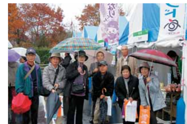
(写真は昨年11月に行った姉妹都市・笠間市への取材・研修の様子) 申込・問い合わせ/秘書広報課 ☎(43)3764

※編集会議の日時が変更になることがありますので、見学に来る際には、事前にご連絡ください。