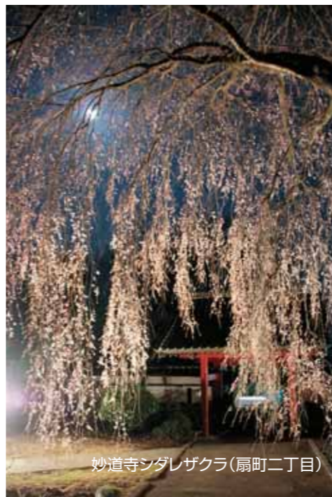
妙道寺シダレザクラ(扇町二丁目)