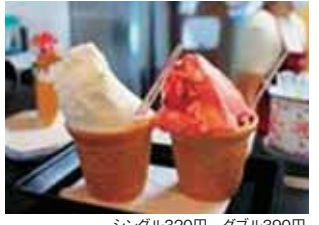
シングル320円 ダブル390円

ジェラート・ともなりくん焼きなど気軽に食べられるファストフードをご提供!ジェラートのフレーバーは定番のミルク、矢板のリンゴを使ったリンゴミルクから季節限定の味まで!!矢板市のキャラクター「ともなりくん」の形をしたともなり焼きは、あんこ・カスタードはもちろん、変わり種も考案中!