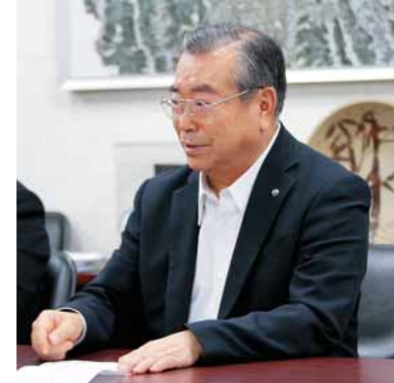
株街なかにぎわい館 代表取締役

シャッター通りや空き地。矢板市のメインストリートが徐々に閑散としていく現状。私自身、商工会会長としてどうにかしなければと思っていました。そんな中、新規の企業家を育てるべく創業塾を昨年開催したところ、19名もの応募が。これは驚きでした。創業を目指す参加者の思いをどうにかかなえてやりたい、育ててやりたい。その思いから、創業塾参加者のスタートの場として株式会社株街なかにぎわい館「ココマチ」を立ち上げるに至りました。 ココマチには高齢者の憩いの場としてさらにサロンも併設。是非たくさんの人にお立ち寄り願いたいと思います。 今後、第2弾・第3弾と私たちは成長します。