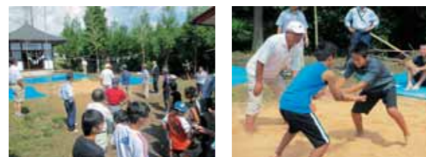
ここで相撲か・・・緊張するな 「絶対勝つ!」「負けなぞ!」

心の教育推進事業は、地域に住むすべての人々が教育について考え、実践することにより、子どもの心を豊かにすることを目的とした事業で、現在9地区で実施中です。 8月24日(日)、平野行政区で「不動尊祭礼子供奉納相撲」が実施されました。約80年以上前から行われている歴史ある行事で、大人を含め総勢約60名が参加しました。幼児から中学生までの子ども達が取組を行い、高学年同士の試合ではとても盛り上がりました。 皆さんのお住まいの地域でもさまざまな行事が開催されています。地域の行事に積極的に参加しましょう。