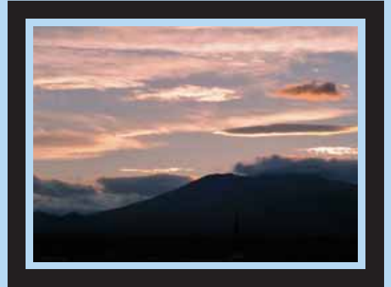
台風一過。豊田の夕暮れ 平成26年 7月11日(金)

「台風が過ぎ去り、高原山の美しい稜線が色鮮やかに浮き上がっていました。思わずシャッターを切りました」