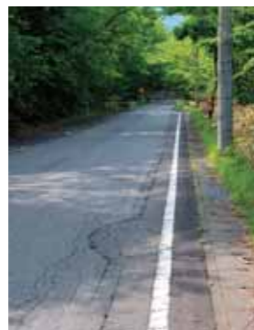
斜度のきつい登り坂が続く

また、練習会でのコースレコードを持っているのが、元宇都宮ブリッツェンの選手であり、それに挑戦することができるというのも魅力の一つです。今大会にも宇都宮ブリッツェンと那須ブラーゼンの選手が参加します。当日は、8時ごろから11時ごろまで交通規制をする予定です。また、応援や見学方法、ボランティアの参加など詳細が決まりましたら、随時、広報やホームページなどでお知らせしますので、皆さまのご理解とご協力をお願いいたします。