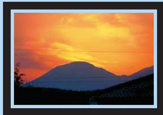
片岡地区の高台から 平成27年3月26日(水)