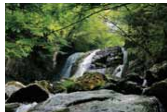
水しぶきと自然のすばらしさが身近に感じられます。 (写真は咆哮霹靂の滝の様子)

日時/7月13日(日) 8:30集合 募集人数/60名 集合場所/山の駅たかはら コース/〈健脚コース〉 雷霆の滝・咆哮霹靂の滝・雄飛の滝 所要時間/5時間程度 参加費/1,500円(送迎バス運行無料 矢板駅7:30発 矢板市役所7:40発) その他/モーニング・飲み物サービス(各自昼食ご持参ください。)