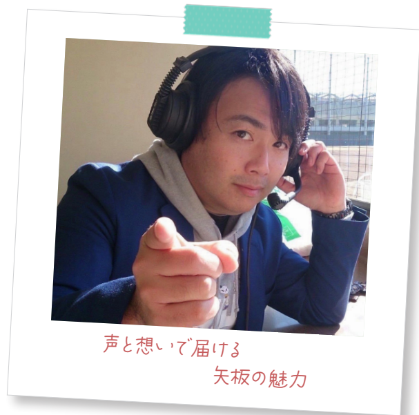
声と想いで届ける 矢板の魅力

宇都宮市出身。テレビでは「クローズアップ栃木」「とちぎ発!旅好き!」などに出演し、「雷様剣士ダイジ」では監督・主役声を担当。CRT 栃木放送やレディオベリーで多数の番組パーソナリティとして活躍するほか、リンク栃木プレックスやH.C. 栃木日光アイスバックスのアリーナ MC も務める。2019 年、やいた応援大使に就任。