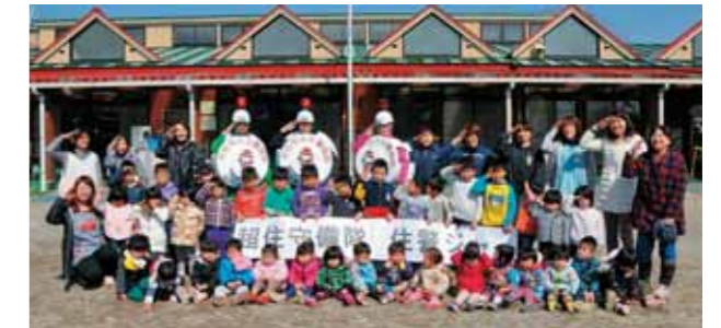
※撮影場所 矢板市立片岡保育所 平成26年3月17日撮影