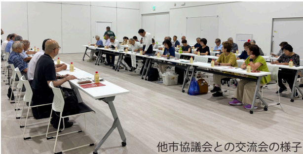
他市協議会との交流会の様子 問い合わせ／ 社会福祉課 ☎（４３）１１１６

民生委員・児童委員は、誰もが安心して生活できるよう、定期的な訪問を通じた見守りや相談への対応、高齢者や子育て家庭の支援など、さまざまな活動を行っています。 主任児童委員は、民生委員・児童委員の中から選ばれ、児童分野に選任して地域の子どもと家庭の「専門相談窓口」となり、学校・福祉・医療など関係機関と連携して見守り・支援・情報提供を行っています。 各委員は秘密を厳守することが義務付けられていますので、安心してご相談ください。 なお、12月1日付で決まりました新任の民生委員・児童委員の皆さんは下表のとおりです。